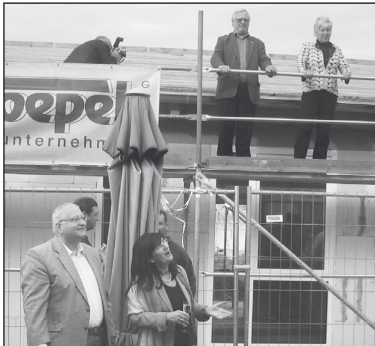
Im 2009 eingeweihten Wohnpark Heide in Lostau wurde Ende Oktober Richtfest für einen Erweiterungsbau gefeiert. Hinter der Pflegereinrichtung der Lewida GmbH entsteht ein separates Gebäude für Demenzzranke. 24 Patienten werden in dem neuen Komplex Platz finden. Die Kosten dieses Bauabschnitts sind mit 1,3 Millionen Euro veranschlagt. Der Bau soll am 1. Mai 2012 fertig sein.