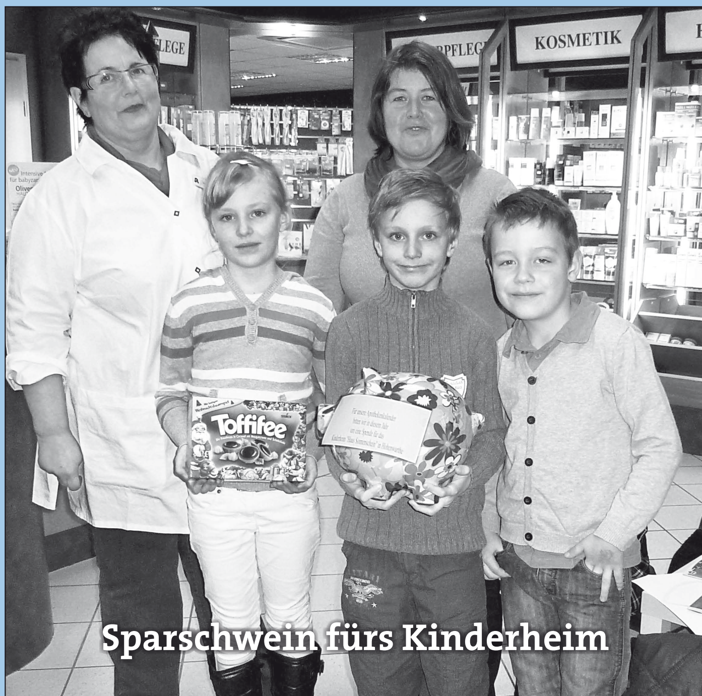
Sparschwein fürs Kinderheim