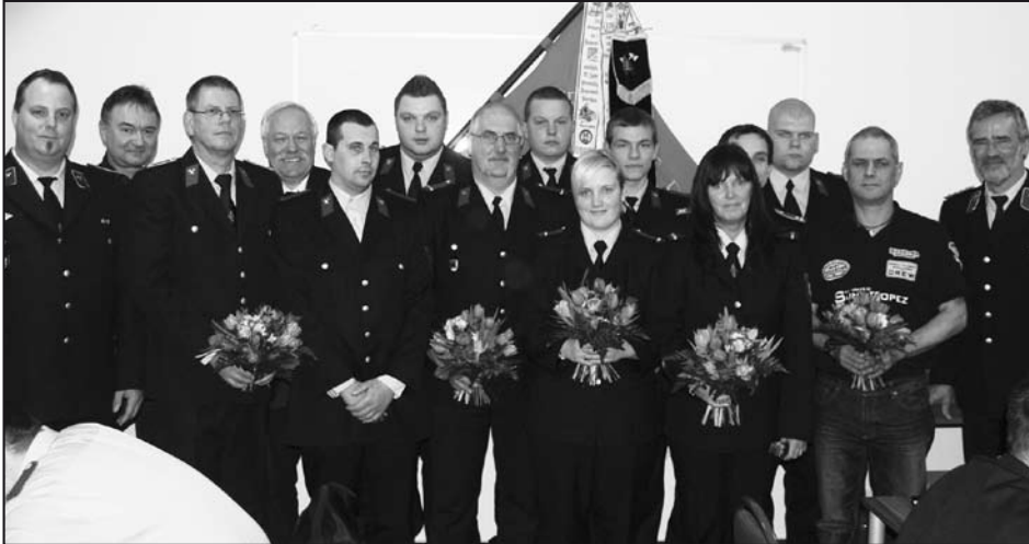
Die ausgezeichneten und beförderten Kameraden der Freiwilligen Feuerwehr Möser.