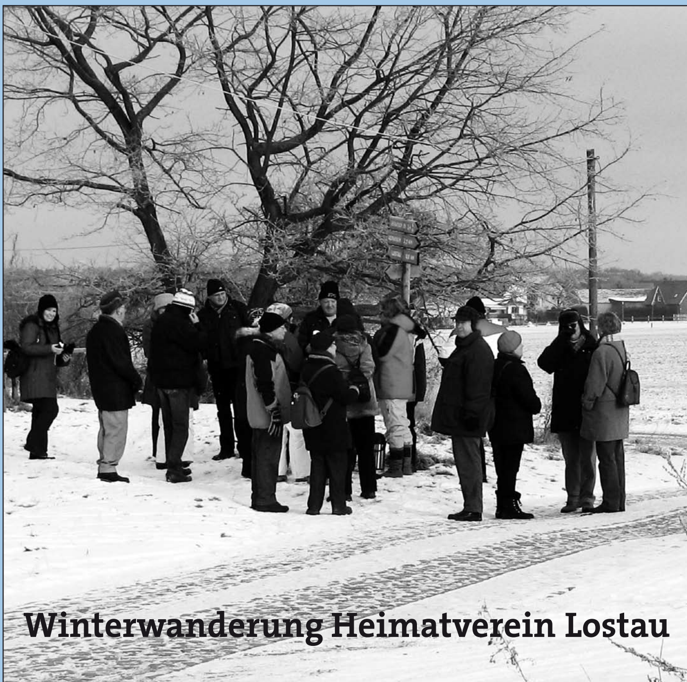
Winterwanderung Heimatverein Lostau