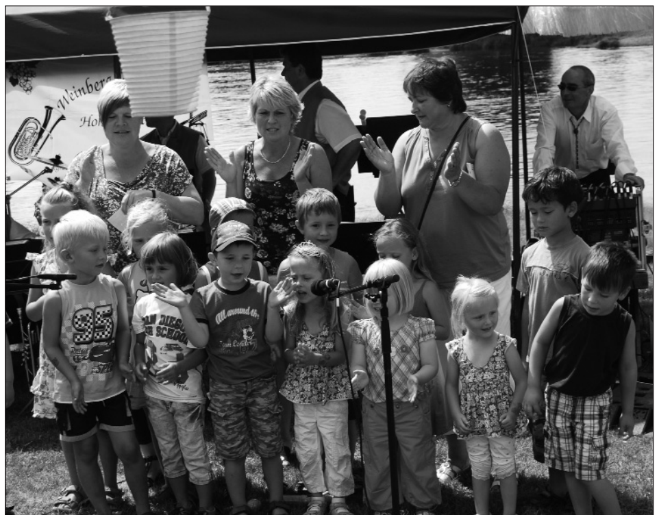
Die Knirpse der Hohenwarther Kita sorgten mit ihren Liedern für gute Stimmung im Rahmenprogramm des Elbebadetages.

Für Frühaufsteher beginnt der Sonntag am 7. August mit einem Wettkampfangeln der