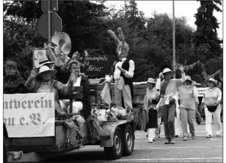
Schnappschüsse vom großen Festumzug anlässlich der 1050-Jahrfeier am ersten Juli-Samstag durch Möser. Mit dabei auch die Grundschule Möser (links) und der Heimatverein Lostau.