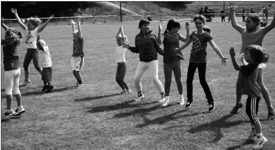
Mit einer zünftigen Gymnastik für Groß und Klein begann am letzten Juni-Samstag das Sportfest des SV Eintracht Hohenwarthe.