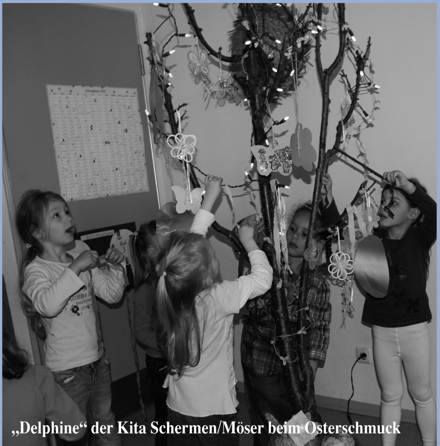
„Delphine“ der Kita Schermen/Möser beim Osterschmuck

Die Mitglieder des TC Möser bereiten sich auf die neue Tennissaison vor und interessierten Neugierigen Schnupperstunden an. S. 9