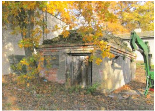
altes Pumpenhaus - Abbruchgebäude