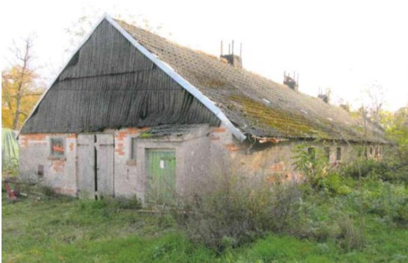
Stallgebäude - Abbruchgebäude